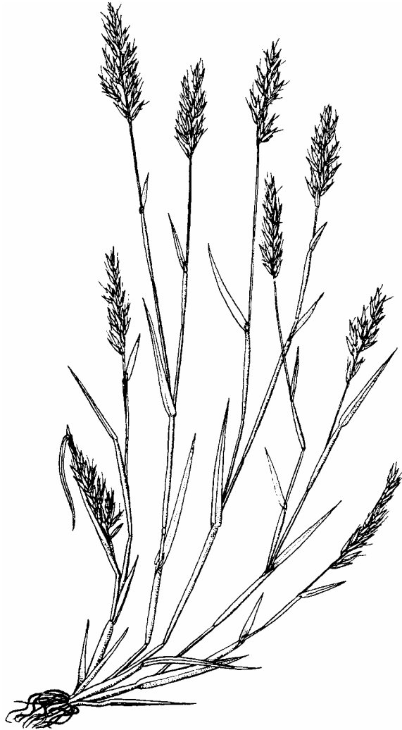
3. ábra. Anthoxanthum aristatum (HUBBARD 1985, cit. SUKOPP 1994).

mal), valamint rozs és zab (ritkán déligyümölcsök) kísérőjeként. A vetőmagtisztítók modernizációját követően a speirochor terjedésnek ma már nincs jelentősége, rövidebb távolságra a faj diasporái természetes úton széllel és vízzel jutnak el. Az antropogén aratási terjesztésnek („Ernteausbreitung”) az A. aristatum esetében napjainkban döntő fontosság tulajdonítható, hisz az arató-cséplőgépek a learatott gyomnövények apró terméseit a pelyvával együtt újra a termőföldre fűjják (pl. az Apera spica-venti esetében is, HILBIG 1987).